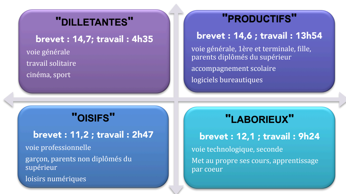
Figure 1. Typologie des manières d'étudier

Une première classe (« les productifs 2 ») est constituée des lycéens les plus studieux : ils travaillent près de deux fois plus que la moyenne des lycéens, utilisent souvent les manuels et communiquent fréquemment avec les enseignants en dehors des cours. Davantage de filles, de lycéens provenant de milieux favorisés, inscrits dans une filière générale et de bon niveau scolaire initial sont présents dans cette classe. Ils présentent les traits de ceux communément appelés les « bons élèves » (Daverne & Dutercq, 2013).